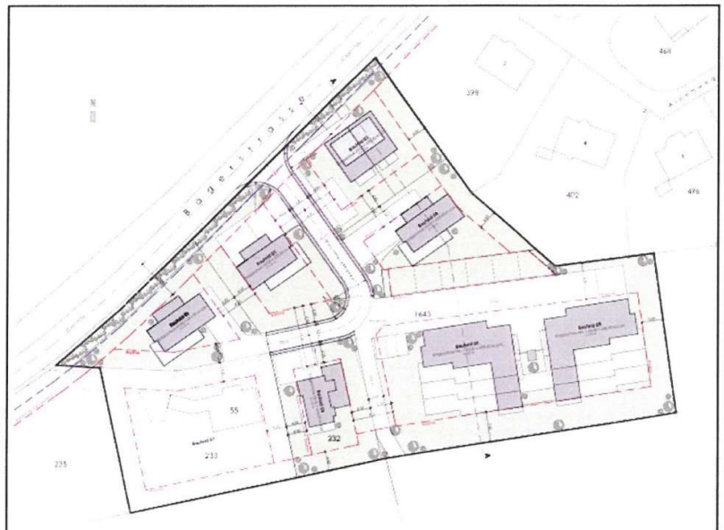
Detailbebauungsplan (DBP) Bager Süd